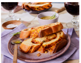
38 Mediterranes Pane bianco 🌿