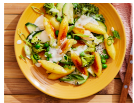
34 Schupfnudeln mit grünem Gemüse in Frischkäse-Sauce 🌿 🌿 🌿