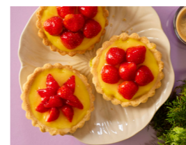
87 Mango-Erdbeer-Tartelettes 🌿