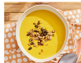
30 Süßkartoffel-Mais-Cremesuppe 📏 🌿