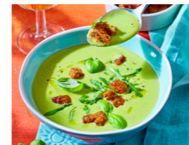
14 Spargel-Rucola-Suppe 🌿 📏 🌿