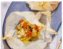
43 Weißer Spargel mit Aprikose und Ziegenkäse im Säckchen 📏