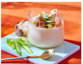
11 Spargel-Parmesan-Creme mit Parmaschinken und Spargelstreifen 📏