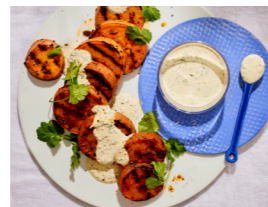
42 Marinierte Süßkartoffelscheiben mit Kräuterjoghurt 🌿 🌿 🌿