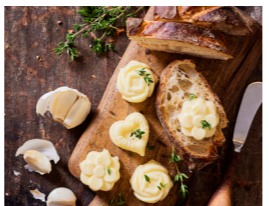
51 Knoblauchbutter 🌿 🌿 🌿