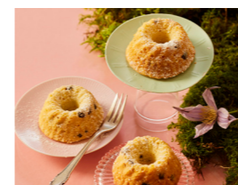
86 Kokos-Mini-Gugelhupfe 🌿 🌿 🌿