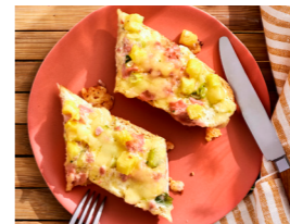
31 Baguette Hawaii