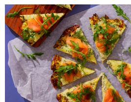
60 Pizza bianca mit Zucchiniboden, Räucherlachs und Rucola 🌿 📏