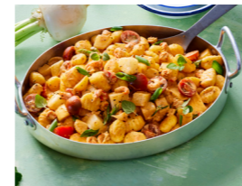
24 Mairübchen-Ragout mit Flusskrebse und Gnocchi 🌿 🌿 🌿