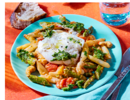
12 Spargel-Tomaten-Ragout mit Burrata und Kräutergremolata 🌿 📏 🌿