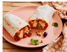
32 Burritos mit Dinkel-Hähnchen-Füllung