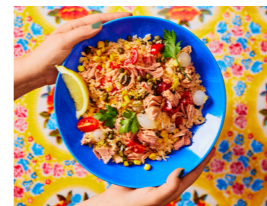
76 Reis-Thunfisch-Salat 🌿 🌿