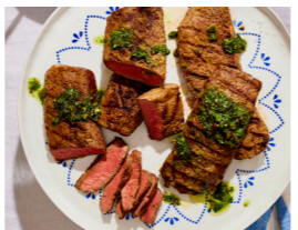
42 Buttermilch-Lamm vom Grill mit Dattel-Gremolata 📏