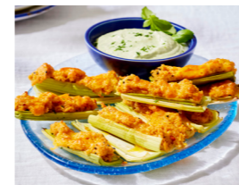
44 Gegrillter Porree mit Käse-Füllung 🌿