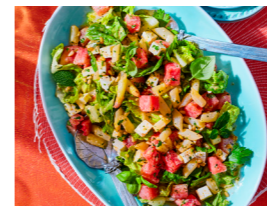
15 Wassermelonen-Spargel-Salat mit Feta 🌿 📏 🌿