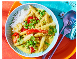
10 Spargel-Korma 🌿 🌿 🌿 🌿