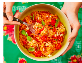
77 Schneller One-Pot-Tomaten-Reis 🌿 📏