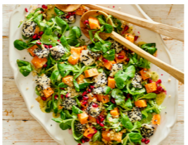
64 Süßkartoffel-Feldsalat mit Sesam-Ziegen-Camembert 🌿 🌿