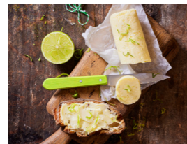
51 Limettenbutter 🌿 🌿 🌿