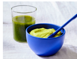
41 Allround-Kräuter-Marinade und -Mayo 🌿 🌿