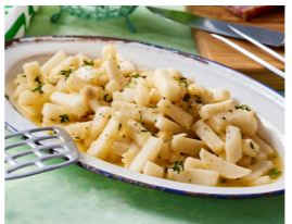
20 Glasierte Mairübchen 🌿 🌿 🌿