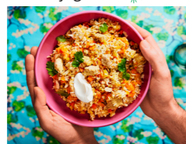
74 Reis-Pot mit Hähnchen 🌿 🌿