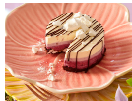
84 Brombeer-Schoko-Eistörtchen 🌿