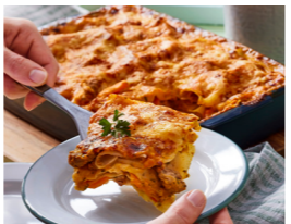
22 Mairübchen-Möhren-Lasagne 📏