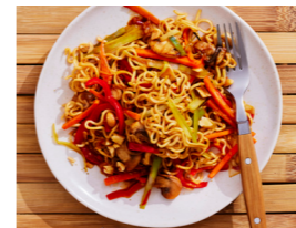
28 Gebratene Mie-Nudeln mit Gemüse 🌿